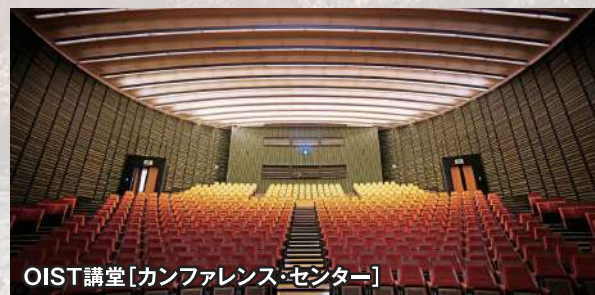
OIST講堂[カンファレンス・センター]